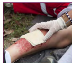
Sencillo de usar y extremadamente efectivo