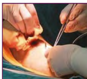
Hemorragias de moderadas a severas