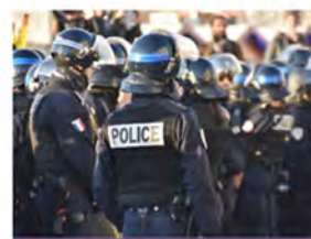
Cumplimiento de la ley