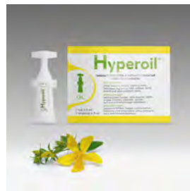
Aceite Hyperoil 5ml vial resellable