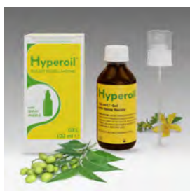
Gel Hyperoil 100ml spray