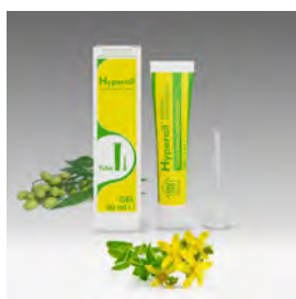
Gel Hyperoil 30ml tubo