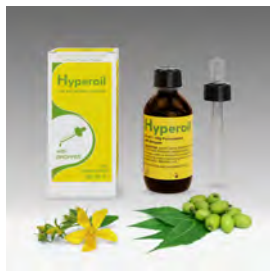
Aceite Hyperoil 50ml gotero