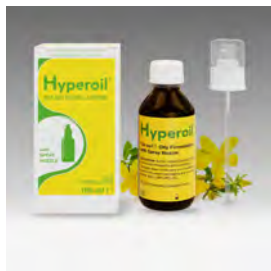
Aceite Hyperoil 100ml spray