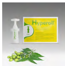
Gel Hyperoil Vial de 5 ml